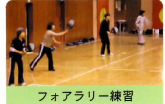
フォアラリー練習