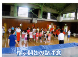
検定開始の諸注意

本テストは日本トランポリン協会が主催するもので、本人の技術錬度の確認と共に安全確保の面からも有効であり、何より、特に子ども達にとっては、成長の過程で「やればできる」「あきらめない」精神の醸成に役に立つものと思われます。周囲の大人たちもそのような心で見守っていきましょう。