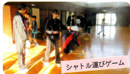
シャトル運びゲーム