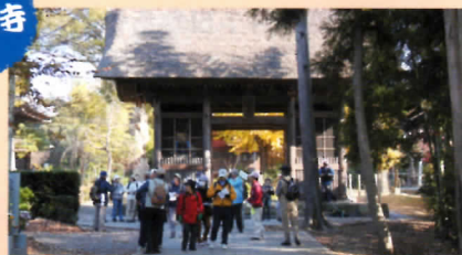
ここに仁王門があるなんて…感嘆の声