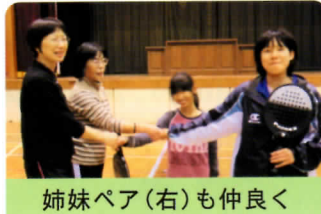
姉妹ペア(右)も仲良く