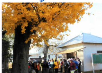
法海寺寝釈迦 時代を語る寝釈迦伝説！