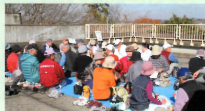
展望 北方が岡堰、晴天時は筑波山が美しい