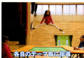
各自のテーマ毎に指導