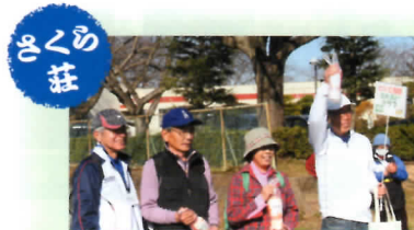
ウォーキングクイズ決勝