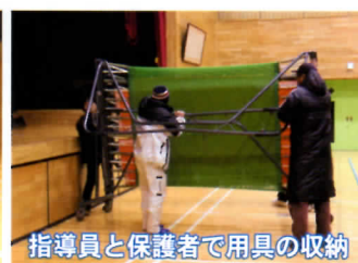
指導員と保護者で用具の収納