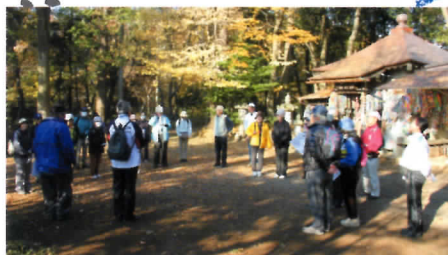
とげぬき地蔵尊 今日はクイズがあります…と紹介。ちょっと緊張のスタート。