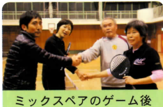
ミックスペアのゲーム後