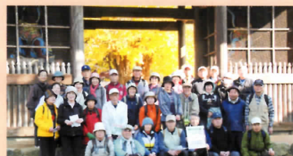
逸話の残る目隠しイチョウ