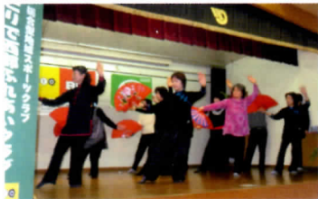
太極拳教室 32式扇の演武

出席人数は84名(男性23名、女性61名)と多数の参加を頂き、恒例の教室活動紹介、歌唱・手品の披露、会場の一隅には、前回に続き会員製作の文化作品の展示、茶の湯の接待も行われ、「話題いっぱい」当クラブならではの新年会となりました。また、有志のご好意による漬物や担当が腕を振った豚汁も好評で満腹になりました。担当の会員各位のご協力には感謝、感謝です。