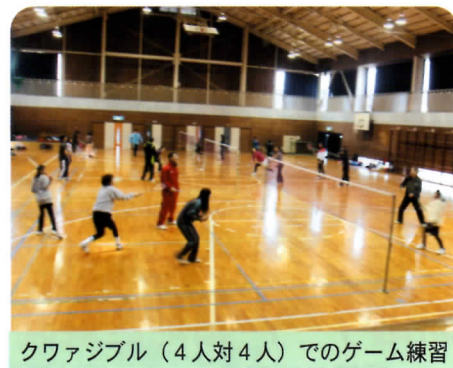
クワジブル（4人対4人）でのゲーム練習

クワジブルス（大人3対子ども1）のゲーム中心で、いかにして楽しく満足するかを、常に練習メニューを工夫し指導しています。