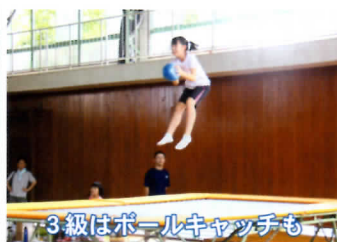
3級はボールキャッチも