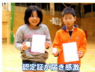
認定証が届き感激