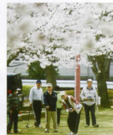
グリーンスポーツセンター広場 周囲の桜開花時は壮観。