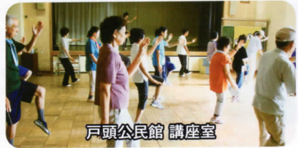
戸頭公民館 講座室