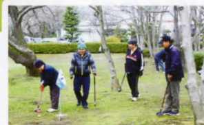
さくら荘会場 ▶ 林間コース、 桜・つつじ・ 藤・紅葉の彩り。