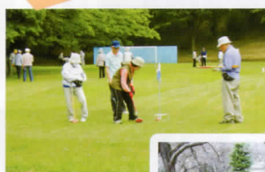
◀ 戸頭公園会場 ゆったりコース、 春秋の風が心地 よい。

当グラウンドゴルフクラブの会場は下記の通り3会場ありそれぞれに特徴もあります。「新しい仲間に出会える」「様々なコースの体験」「四季を味わう」楽しさいろいろです。