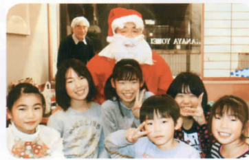
このサンタの 写真は昨年 のものです。