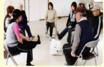
自分の体力に合わせて