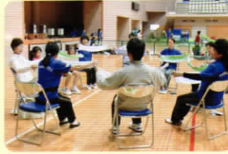
身近なタオルでも…