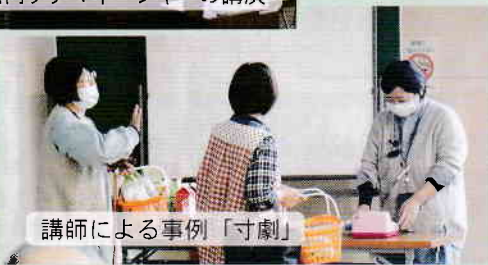
講師による事例「寸劇」