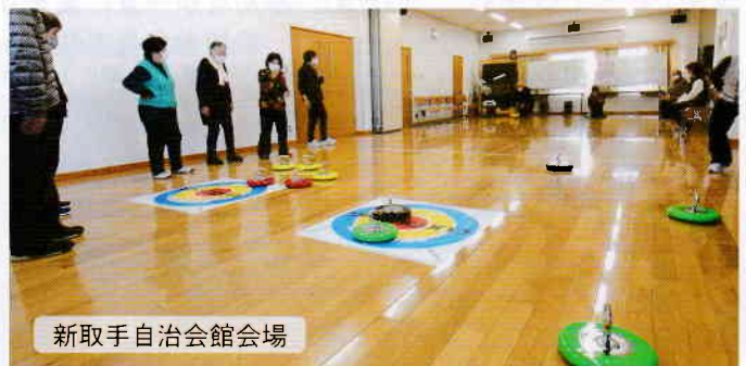
新取手自治会館会場