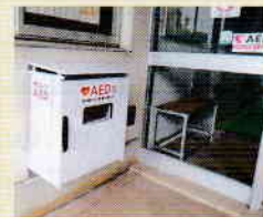
旧戸頭西小は正門側玄関