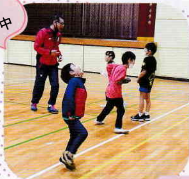
高井小体育館会場