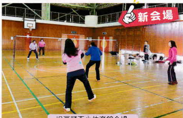
旧戸頭西小体育館会場

7月からは今までの高井小（土曜日）に加えて、月・金で旧戸頭西小会場が始まると同時に、新規会員が6名加わり、大人中心の熱気溢れる、そして、和気あいあいとした雰囲気の練習です。都合がつく時は両会場に参加の会員もあり、練習の機会が増えて喜んでます。