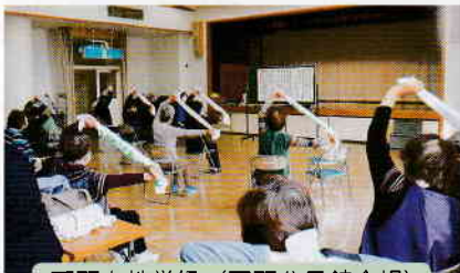
戸頭女性学級 (戸頭公民館会場)

出前教室は、市内団体の要請にお応えし、指定場所に出向き体操等の指導をするもので、らくらく体操は2015年度から始め、2018年度では年11回の実績となり、その後、コロナ禍で中断。2022年度は、戸頭・桜が丘・井野等の女性活動団体間の連携活動が復活し、団体間の活動成果となっており、今後も推進していきます。