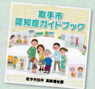
取手市役所 高齢福祉課