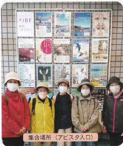
集合場所(アビスタ入口)