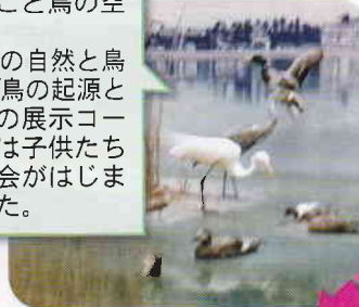
手賀沼親水広場・水の館

館内はとり・トリ・鳥…丸ごと鳥の空間。「手賀沼の自然と鳥たち」「鳥の起源と進化」の展示コーナーでは子供たちの勉強会がはじまりました。