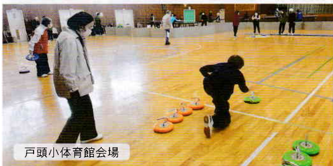
戸頭小体育館会場