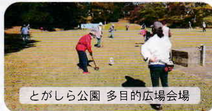
とがしら公園 多目的広場会場

グラウンドゴルフ教室の活動は、さくら荘・とがしら公園多目的広場の2会場で行っています。このため、みんなが一堂に集まりプレーすることが難しいため「教室内交流会」として、参加者全員でゲームを行い会員間の懇親と技術交流向上の場として毎年実施しています。