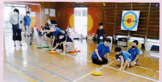
こんどこそまっすぐに……