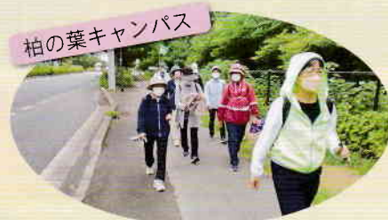
柏の葉キャンパス