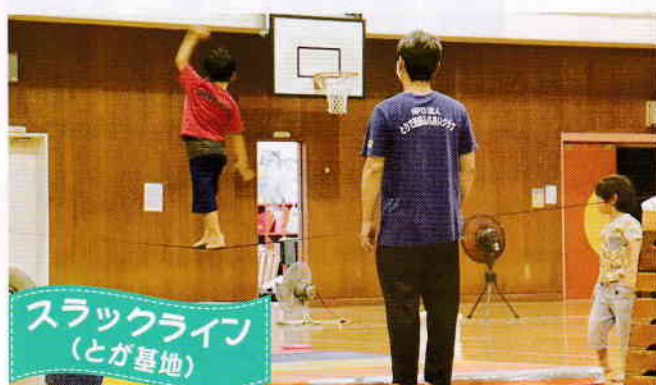
スラックライン (とが基地)

活動会場は当会場と戸頭小体育館の2会場。会員も20名を超え両会場とも活発に活動。戸頭小に卓球台を1台増設しました。