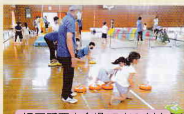
旧戸頭西小会場 7/16(土)