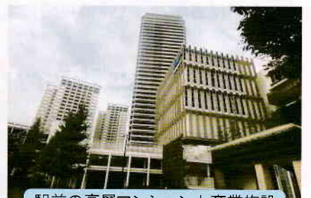
駅前の高層マンションと商業施設