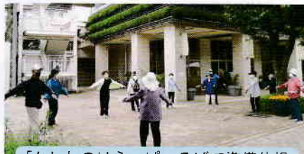
「かしわのはらっぱ」そばで準備体操