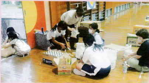
前日の準備に子供会員も手伝ってくれました。