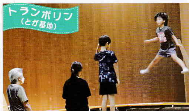
トランポリン (とが基地)

教室指導は初心者クラス。基本の基本から優しく指導。ついで連盟で規定する10段階の基本姿勢へチャレンジ。まずは見学・体験を!