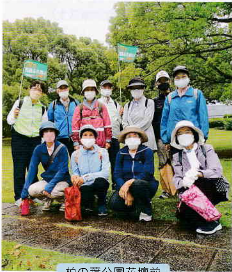
柏の葉公園花壇前