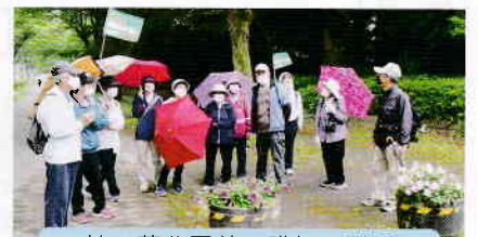
柏の葉公園前で講師の説明