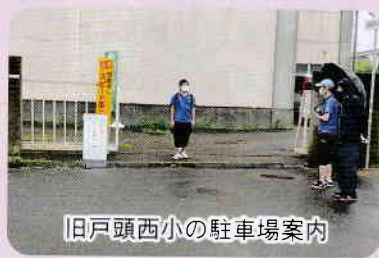
旧戸頭西小の駐車場案内