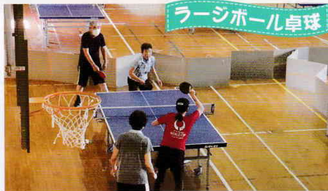
ラージホール卓球

いろいろ球技は様々な球技を体験し、自分にあった種目を見つける体験の場を提供します。また、基本的な体力作りを指導します。