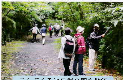
こんぶくろ池自然公園を散策