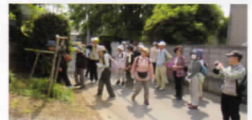
小さな鳥の博物館

コース 戸頭お休み処前 集合8:30→みずき野さくらの杜公園→小さな鳥の博物館→野外ステージ→(探鳥の道)→守谷沼→守谷駅前 解散14:30