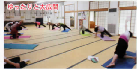
ゆったりと大広間

現在 さくら荘はゆるヨガの他、グラウンドゴルフ、太極拳の定例教室会場でもあります。ぜひ、お互いの教室参加を増やし、ご近所の方、ご友人へもクラブへのお誘いをお願い致します。