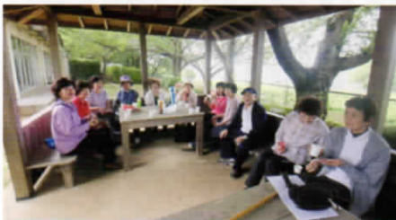
あずま屋内のお茶会。北側が小貝川、岡堰。筑波山も遠くに見えます。

このようにまだスペースに余裕があるので月曜の午後、時間のあいている会員はお誘い合わせてぜひ参加されるようお待ちしております。 広報記