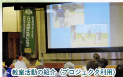
教室活動の紹介(プロジェクト利用)