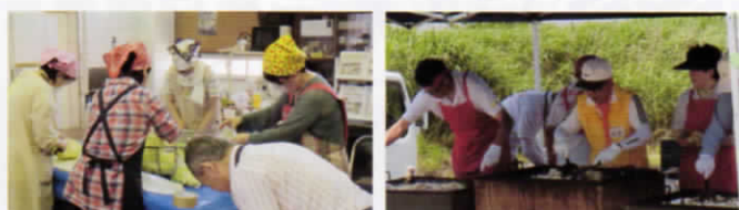
前日の食材準備も台同で、バーベキュー大忙し!