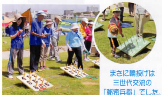
まさに輪投げは 三世代交流の 「秘密兵器」でした。