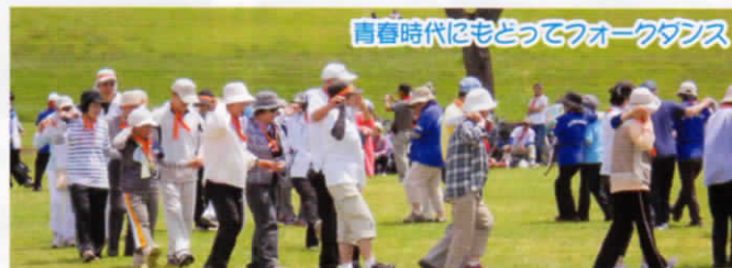
青春時代にもどってフォークダンス