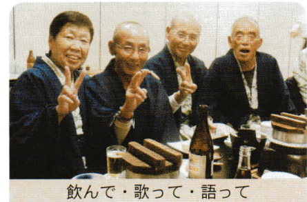
飲んで・歌って・語って