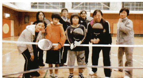
老若男女仲良く活動をしています。

現在は夜間ですが、戸頭西小閉校に伴い昼間の教室を追加予定でいます。いつでも体育館でお待ちしております。