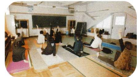
戸頭東小学校 多目的室