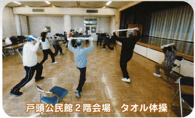
戸頭公民館2階会場 タオル体操