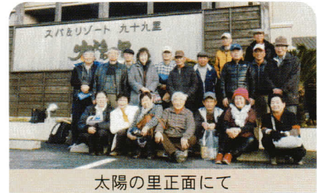
太陽の里正面にて