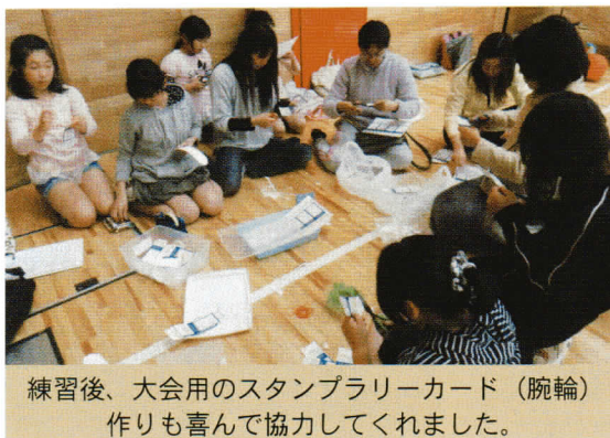
練習後、大会用のスタンプラリーカード（腕輪） 作りも喜んで協力してくれました。

また、年間活動では、春のスポーツフェスティバルのスタンプラリーカード（腕輪）300枚を教室の親子で作りました。そして恒例のクリスマス会では新しい仲間と楽しくおしゃべりと食事会を行いました。これからの成長が楽しみです。