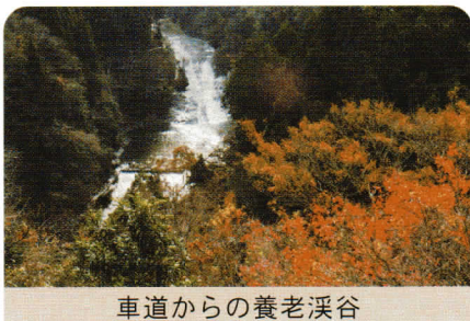
車道からの養老溪谷