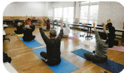
永山小学校 コミュニティスペース